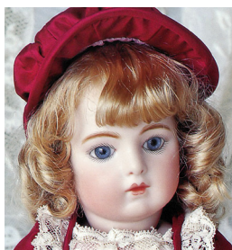
ミレット・EJジュモール 〔身長 27cm〕 ボディは コンポジション or オールビスク