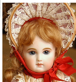
ミレット・ブリュ 〔身長 27cm〕 ボディは コンポジション or オールビスク