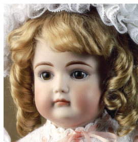
ケストナー・XI 〔身長 38cm〕 布ボディ 頭、肩、手、足はビスク