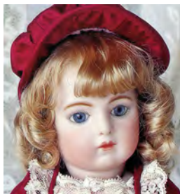
ミレット・EJジュモール 〔身長 27cm〕 ボディは コンポジション or オールビスク