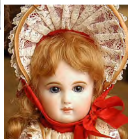
ミレット・ブリュ 〔身長 27cm〕 ボディは コンポジション or オールビスク