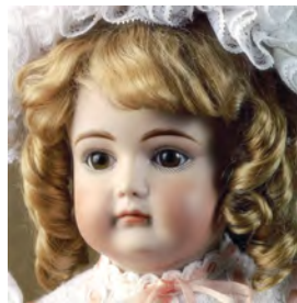
ケストナー・XI 〔身長 38cm〕 布ボディ 頭、肩、手、足はビスク